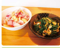
季節の野菜を使った惣菜