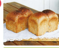
横浜小麦の食パン