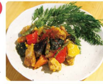
彩り野菜のみぞれ和え