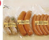
横浜ウインナ、横浜野菜フランク