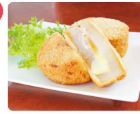
季節の野菜を使った総菜