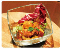
季節野菜の米雑味噌カボチャ