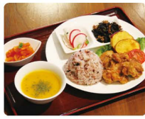
一汁三菜プレート