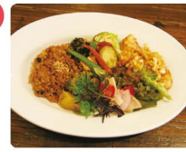
地元野菜たっぷり日替わり