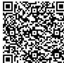
電子申請・届出システム

今月の自治会・町内会配送ルートにて各自治会・町内会長の皆様に資料を1部送付いたします。