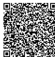
お問い合わせフォーム

今月の自治会・町内会配送ルートにて各自治会・町内会長の皆様に資料を送付いたしますので、掲示板への掲出についてご協力をよろしくお願いいたします。