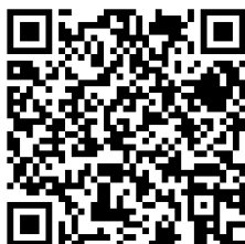
横浜市 WEB ページ